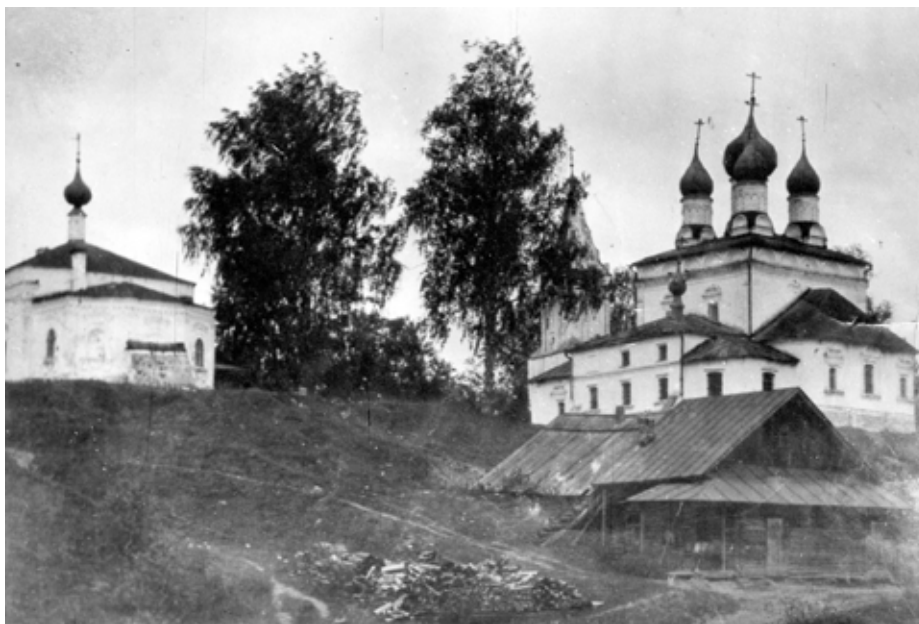
Алферьевские храмы до разрушения