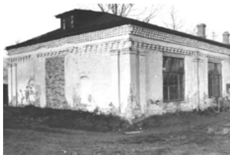
Фотографии 1974 года

Возрождение храма Святителя и Чудотворца Николая началось в начале XXI столетия. Он был вновь освящен 5 июня 2006 года.