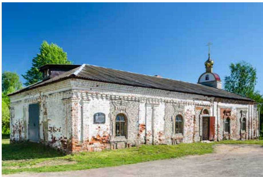
Современный вид храма Святителя и Чудотворца Николая

И уже на рубеже XX–XXI веков Божиим промыслом и стараниями прихожан прихода храма Святителя и Чудотворца Николая села Алферьево было обнаружено не только место источника, но и верхнее восьмигранное бетонное