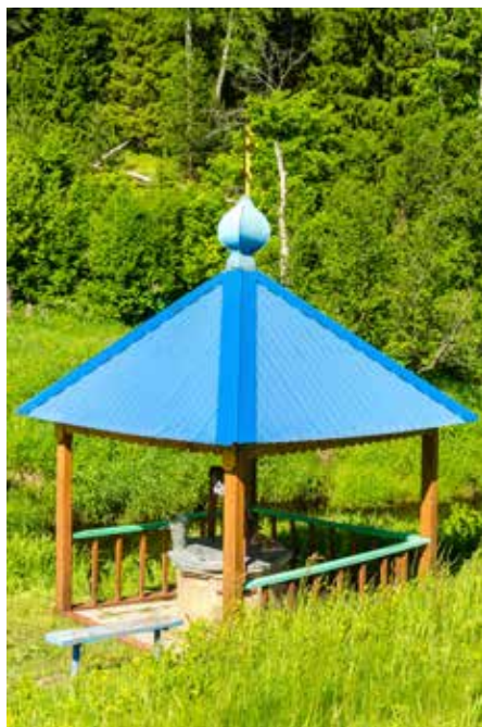
Источник Или Муромца Печерского